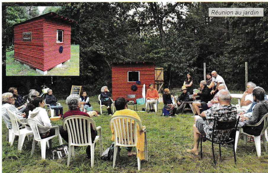
Réunion au jardin

Ce jardin, situé sur un terrain communal, nous a été très précieux en temps de Covid car il nous a permis de continuer à nous retrouver à un moment où les salles n'étaient plus accessibles. Comme on ne sait pas ce que l'avenir nous réserve, nous continuons de privilégier les activités d'extérieur.